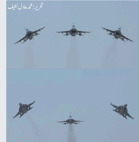
تحریر: محمد عادل لطیف