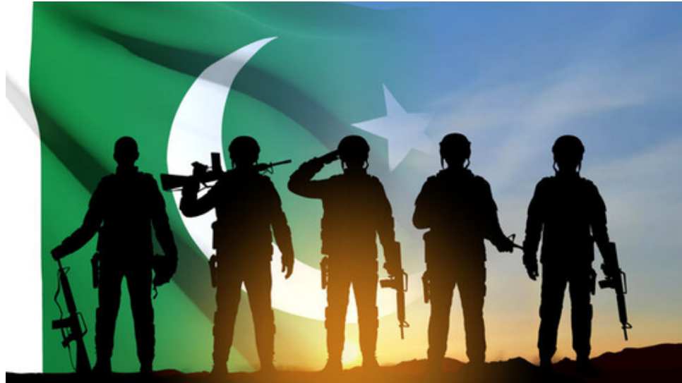
بٹکر یہ FM101 لاہور

پاکستان کا جوابی وار کوئی اندھا غصہ نہ تھا بلکہ یہ تہی تلی، محتاط اور انتہائی پُر اثر کارروائی تھی۔ ہر کارروائی کے ساتھ ایک پیغام بھی تھا کہ ہم جنگ نہیں چاہتے لیکن ہم جارحیت کو کبھی برداشت نہیں کریں گے۔ یوگلاہٹ، دوستانہ فائر اور اندرونی انتشار جیسی رپورٹس سے معلوم ہوتا ہے کہ بھارتی فوج کے افسران میں فیصلہ سازی کی صلاحیت مفلوج ہو چکی ہے۔ نقصان کو چھپانے کی بھارتی کوششیں سچ پر پردہ ڈالنے میں بری طرح ناکام رہی ہیں اور نہ ہی ان کا پُر و پیکند بھارتی شہروں پر گھٹے ہوئے سارن کے شور اور بین الاقوامی رد عمل کو دبا سکا۔ امریکہ جس نے ابتدا میں اس جنگ سے لگاتار کی پالیسی اپنائی تھی۔ اس جنگ میں مداخلت پر مجبور ہو گیا۔ اس کی وجہ فریقین کی درخواست نہیں تھی بلکہ اپنے عزم و ارادے میں پاکستان اور اس کی مسلح افواج کی واضح ترجیحات اور کامیابیاں تھیں۔ سول ملٹری مکمل ہم آہنگی کے ساتھ پاکستان کی سیاسی قیادت نے سفارت کاری کا محاذ سنبھالا جبکہ اس کی مسلح افواج نے طاقت، تحمل اور دفاعی بصیرت کے ساتھ فوجی محاذ کا تحفظ یقینی بنایا۔ یہ ایک ایسا جنگ بندی کا معاہدہ تھا جو کسی دباؤ میں آ کر کیا گیا ہو۔ پاکستان نے اپنا پُریشن اس لیے ختم نہیں کیا کہ اس کو مجبور کیا گیا تھا بلکہ اس پُریشن نے اپنے مقاصد حاصل کر لیے تھے جو جارح اور سزا دینا، اپنے دفاع کو یقینی بنانا اور بغیر کسی شہ کے اس بات کو واضح کرنا تھا کہ کسی بھی جارحیت کا جواب متحدہ ہو کر بھر پور انداز سے دیا جائے گا۔